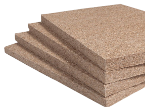
Konope panel tvrdá doska

Rozmery: 1200 mm*600 mm 1100mm*600mm od hrúbky 40 mm