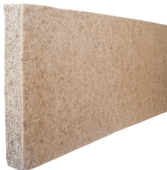
Konope flex mäkká doska

Rozmery: 1200 mm*600 mm 1100mm*600mm od hrúbky 40 mm